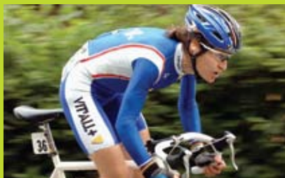
Jeannie LONGO, 13 fois championne du monde et 1 ère au classement national français 2010, est la marraine du salon Naturissima 2010.